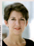
Mag. Barbara Prammer Präsidentin des Nationalrats